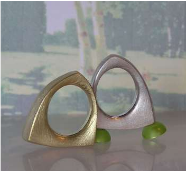
Ringe von Ulrike Blindow, die im schauraum ausgestellt werden.

Mehr Informationen und das komplette Angebot gibt es unter: https://schauraum-BKrlp.de