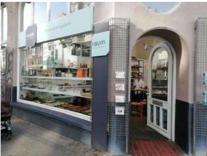
Produzentengalerie „raum Handwerk&Design“ in Bremen

Die Produzentengalerie „raum Handwerk&Design“ ist in Bremen der Ort für gut gestaltete, handgefertigte Alltagsbegleiter für Zuhause und zum Verschenken. Von September bis März präsentieren und verkaufen drei Kunsthandwerker*innen aus Bremen und Umgebung ihre Arbeiten aus Porzellan, Stahl und Holz. Viele Stücke von Lieblingskolleg*innen aus ganz Deutschland ergänzen das Angebot. raum Handwerk&Design, Produzentengalerie, Ostertorsteinweg 68, 28203 Bremen, https://raum-handwerkdesign.de/