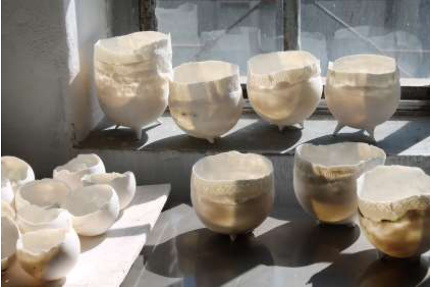
Gefäße von Angelika Karoly – Atelierhaus Terra, deren Arbeiten in der Ausstellung Momento mori zu sehen sein werden.

Die Ausstellung wurde in Kooperation mit Staatliche Schlösser und Gärten und der Akademie der Bildenden Künste Stuttgart erstellt. Sie läuft vom 12. September bis 31. Oktober 2020 und wird am 11. September um 17.30 Uhr eröffnet. Zu sehen sein wird Momento mori im Schloss Favorite Ludwigsburg, Öffnungszeiten: Sa, So und feiertags 12 bis 17 Uhr.