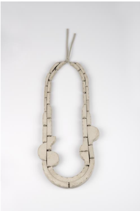
Halsschmuck von Samira Goetz – 1. Preis

Am 16. März 2019 fand anlässlich der Internationalen Handwerksmesse IHM in München die Preisverleihung des 2006 erstmals ausgelobten BKV-Preises für Junges Kunsthandwerk statt. Aus insgesamt 98 Einreichungen, die in diesem Jahr aus 20 Ländern eingingen, ermittelte die Jury drei Preisträger und zwei Belobigungen. Mehr Informationen gibt es beim Bayerischen Kunstgewerbeverein unter Fon 089-2901470, mailto:info@kunsthandwerk-bkv.de , www.kunsthandwerk-bkv.de