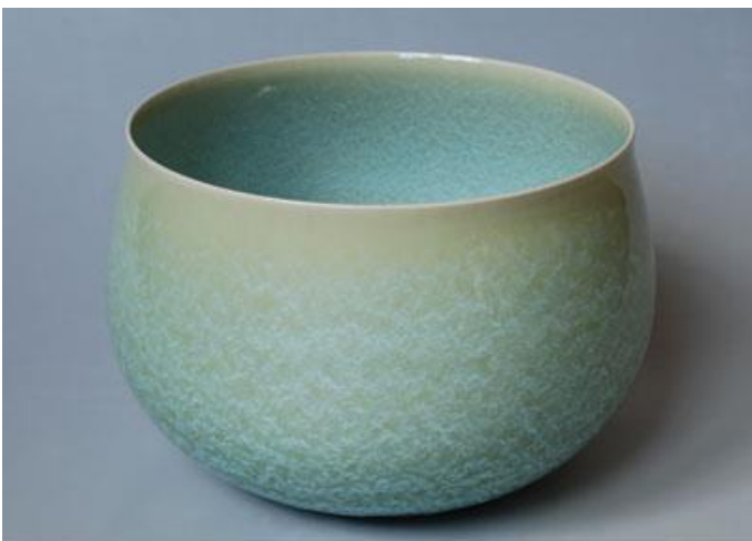
Schale von Kenji Fuchiwaki

Vom 5. bis 12. Mai 2019 ist im Residenzschloss Ludwigsburg die Ausstellung von Kenji Fuchiwaki zu sehen. Ort: Schlosstraße 30, 71634 Ludwigsburg, die Ausstellung ist täglich von 10 bis 17 Uhr geöffnet.