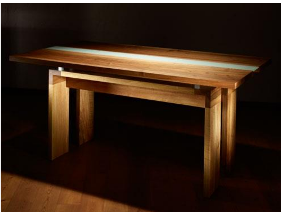
Tisch von Marcel Wiehn – Holzwerkstatt Frankelbach

Holzwerkstatt Frankelbach, Manufaktur für Unikatmöbel, www.holzwerkstatt-frankelbach.de