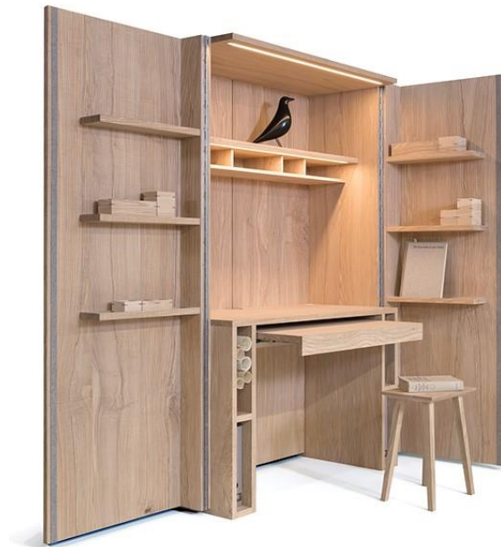
Schrankoffice der Tischlerei Sommer