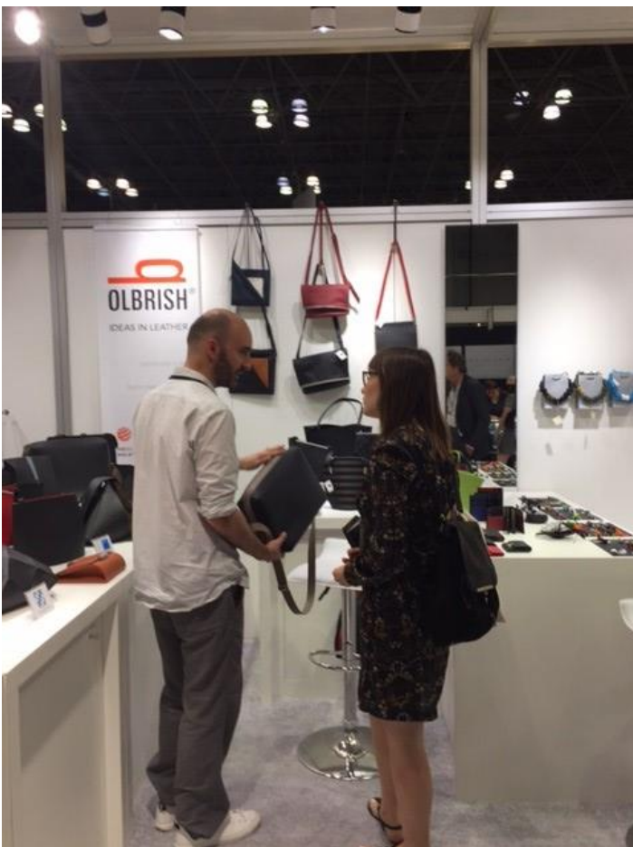
German Crafts auf der NY NOW im Sommer 2018

Im August 2019 bietet das Bundesministerium für Wirtschaft (BMWi) im Rahmen der amtlichen Beteiligung der Bundesrepublik Deutschland in Kooperation mit dem Deutschen Ausstellungs- und Messeausschuss (AUMA) und dem BK wieder eine Ausstellungs- und Messebeteiligung für Kunsthandwerker während der NY NOW an. Wir freuen uns über die rege Beteiligung zur Show im August 2019.