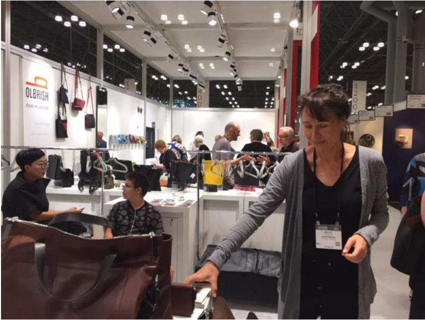
BK-Mitglieder auf der NY NOW im Sommer 2018