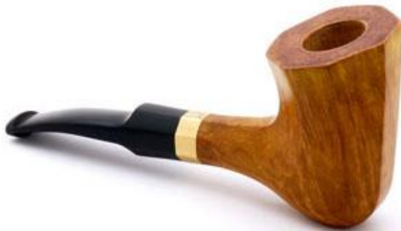
Pfeife von Gustav Kenngott, aufgenommen beim Fotoworkshop 2018

Auch in diesem Jahr wird wieder in den Räumen des BK in Frankfurt der Workshop Sachfotografie mit Anna Schamschula durchgeführt. In dem Workshop werden die Grundlagen für eine gelungene Aufnahme mit einfachen Mitteln und auch die anschließende Bildbearbeitung am PC geübt. Für dieses Jahr ist der Workshop bereits ausgebucht und wir wünschen den Teilnehmern zwei schöne Tage in Frankfurt mit vielen neuen Erfahrungen und Ideen.